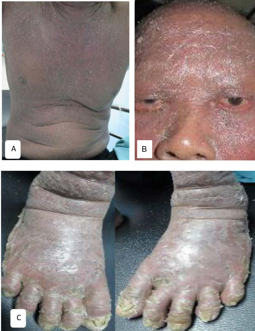
Gambar 1. A. pada hamper seluruh tubuh tampak eritematosa dengan skuama tebal berwarna putih, B. palpebra okuli tampak ektropion, C. kuku tampak iskolorisasi dan hiperkeratosis subungual.

tampak diskolorisasi (berubah warna menjadi kuning kecoklatan) dan hiperkeratosis.